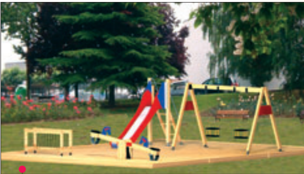
PROYECTO 3: 9 \times 8 = 72 \text{ m}^2 (Ref. 327/M - Ref. 354 - Ref. 326 - Ref. 330/2)