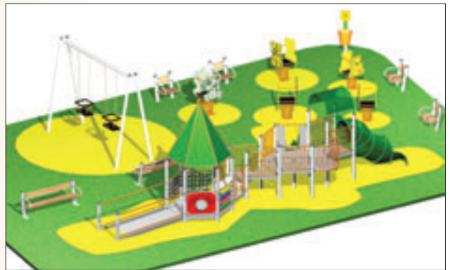
ZOO LANDIA (de 1 a 5 años)