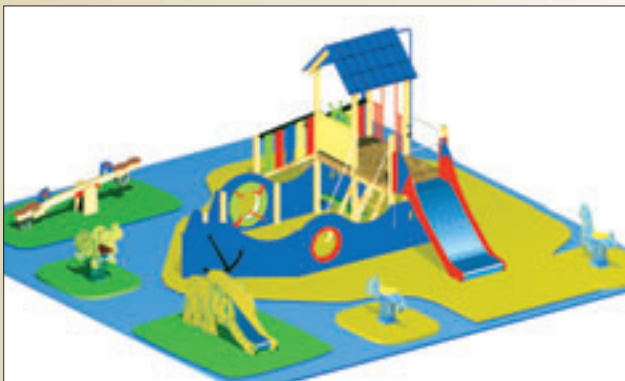
ISLA ROBINSON (de 1 a 8 años)