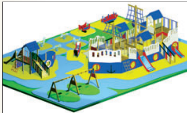
OCÉANOS DE JUEGO (de 1 a 12 años)