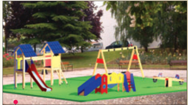
PROYECTO 6: 10 \times 12 = 120 \text{ m}^2 (Ref. 336 - Ref. 327 - Ref. 326 - Ref. 600)