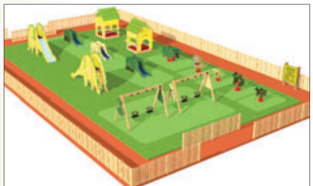
PARQUE JURÁSICO (de 1 a 5 años)