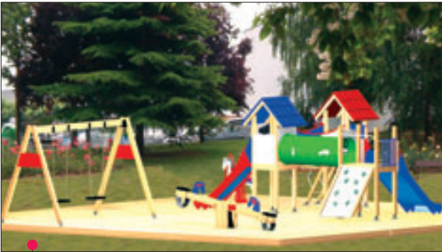
PROYECTO 5: 10 \times 10 = 100 \text{ m}^2 (Ref. 327 - Ref. 326 - Ref. 350 - Ref. 381 M28)