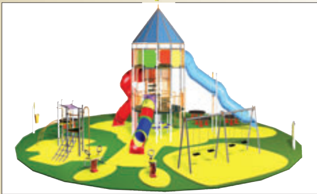
LA TORRE GIGANTE (de 7 a 12 años)