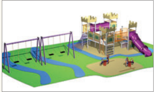
EL CASTILLO MEDIEVAL (de 3 a 8 años)