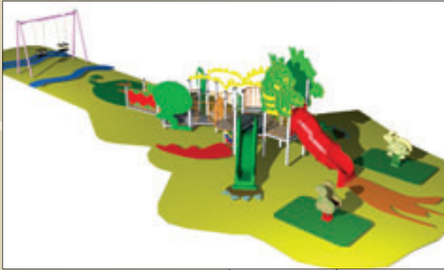
EL DRAGÓN DE MONDRAGÓN (de 1 a 5 años)