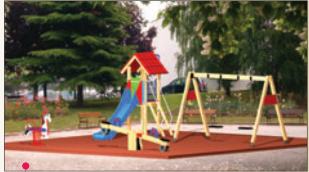
PROYECTO 2: 9 \times 8 = 72 \text{ m}^2 (Ref. 350 - Ref. 326 - Ref. 327 - Ref. 361)