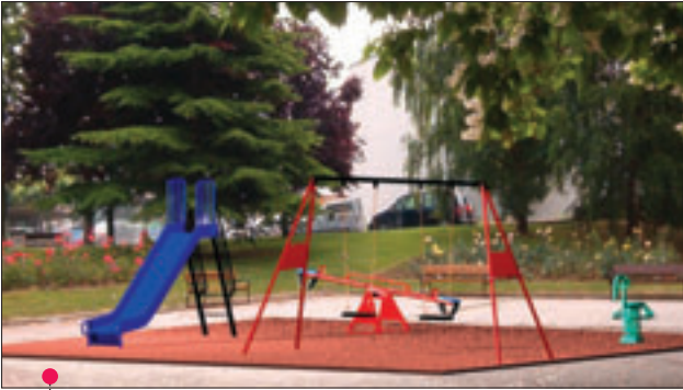
PROYECTO 1: 9 \times 8 = 72 \text{ m}^2 (Ref. 122 - Ref. 5/2 - Ref. 216 - Ref. 40)