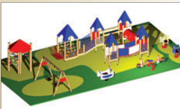
LA CIUDAD DE LOS PITUFOS (de 1 a 5 años)