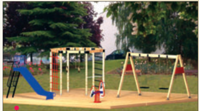
PROYECTO 4: 9 \times 10 = 90 \text{ m}^2 (Ref. 122 - Ref. 350 - Ref. 309 - Ref. 327)