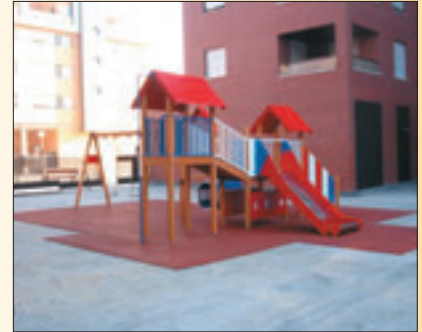
INSTALACIÓN CON BISEL