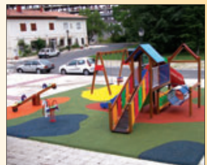
INSTALACIÓN PAVIMENTO CONTINUO